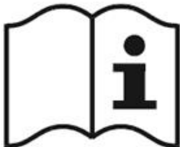
Рисунок 3 - Пиктограмма